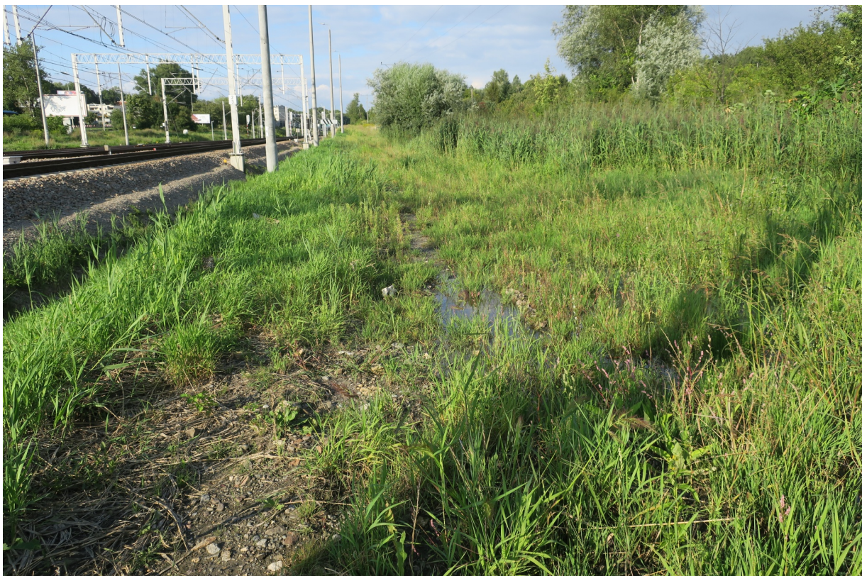
Rys. N13. Zalegająca woda na nasypie PKP, która nie spływa na sąsiednią działkę, bo cały teren jest podmokły.