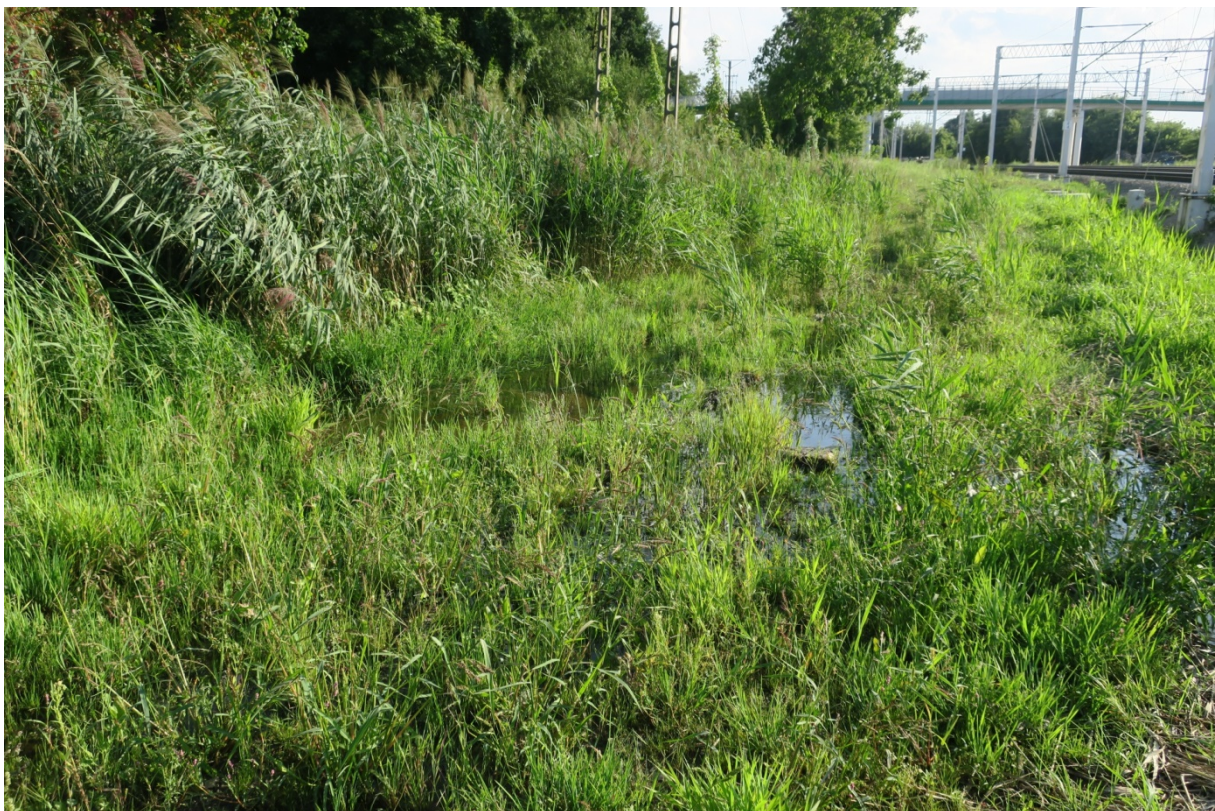
Rys. N15. Zalegająca woda na nasypie PKP i sąsiedniej działce.