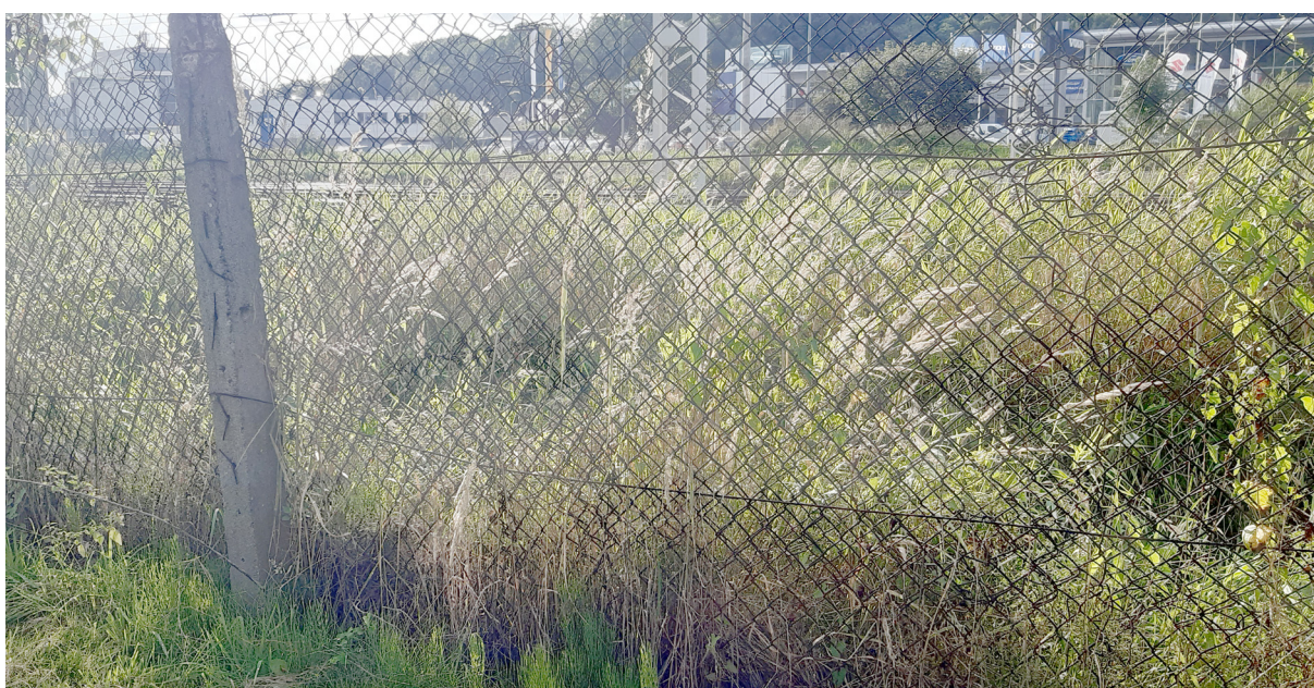
Rys. N03. Zdjęcie zrobione po modernizacji linii kolejowej (obecnie). Widoczne zwiększenie wysokości nasypu na przylegającej działce, w wyniku czego cała woda z nasypu spływa na teren ROD.