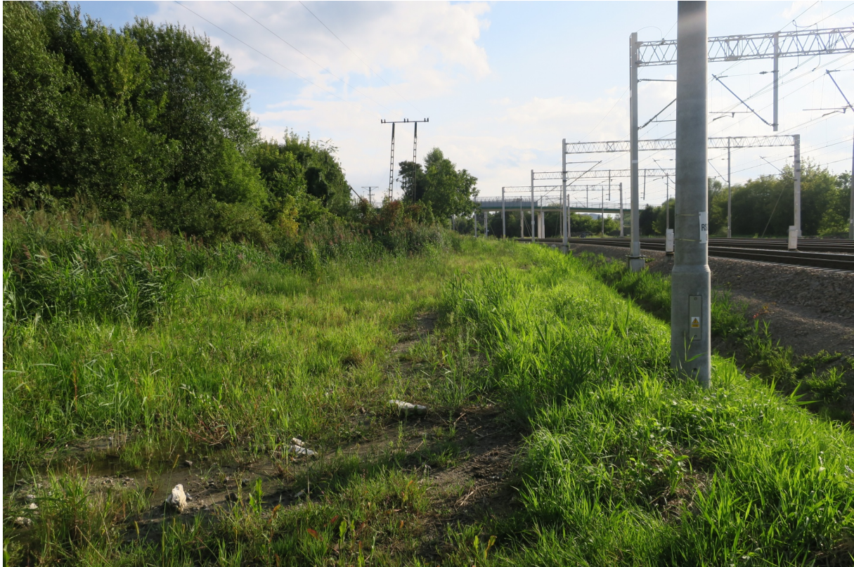
Rys. N10. Widoczne nachylenie nasypu na działce PKP w kierunku ogrodu ROD „Podgórze”.