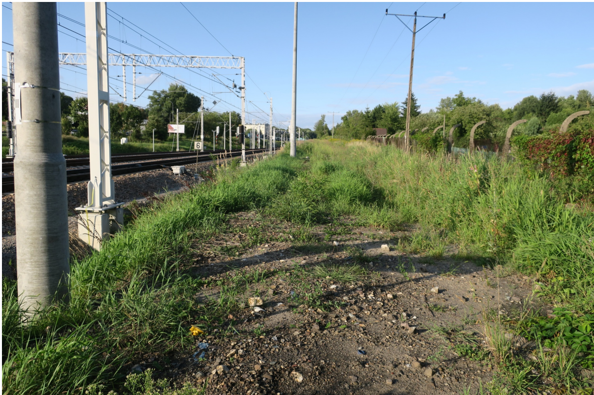
Rys. N11. Widoczne nachylenie nasypu na działce PKP w kierunku ogrodu ROD „Podgórze”.