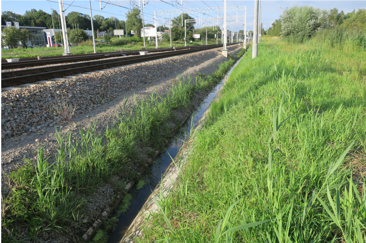
Rys. N016. Rów odwadniający podtorze.