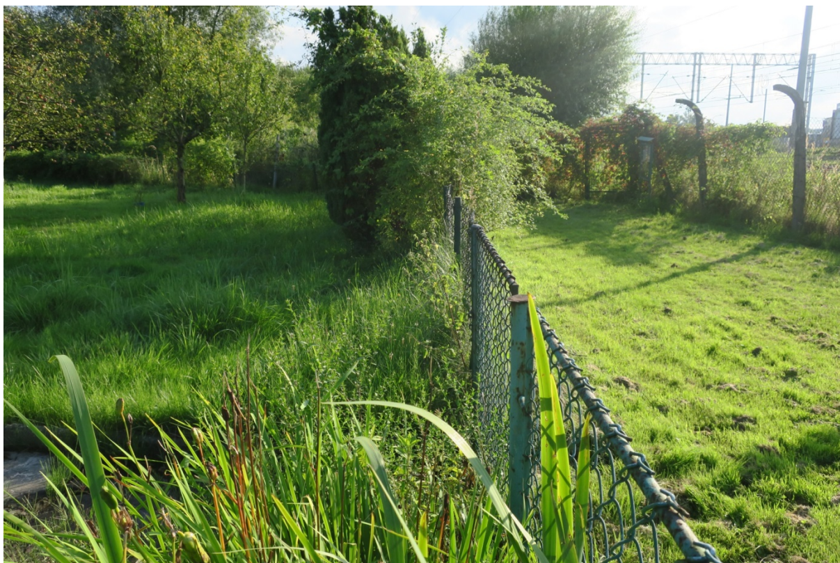
Rys. N04. Zalegająca woda na działce ROD „Podgórze” z powodu podniesienia nasypu kolejowego i braku rowu odwadniającego.