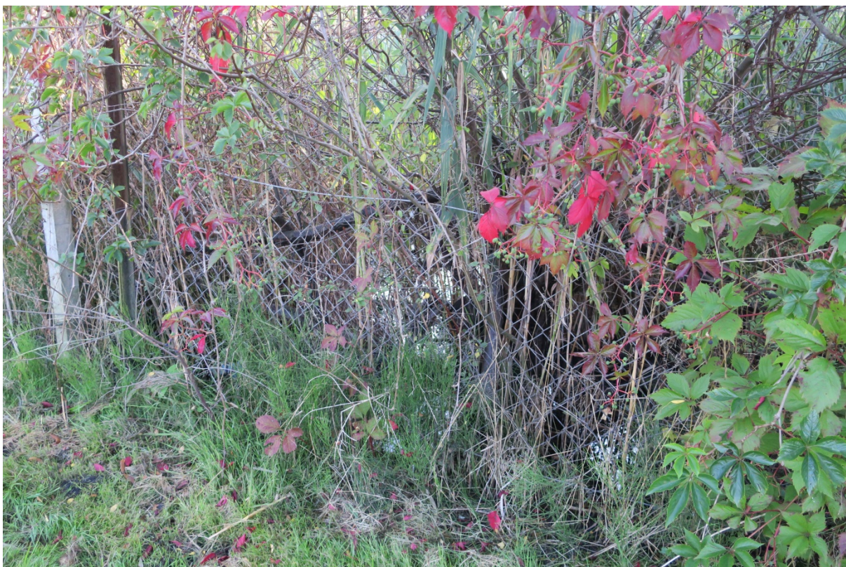
Rys. N07. Zalegająca woda na działce sąsiadującej z ROD „Podgórze”. Zbliżenie Rys. N06.