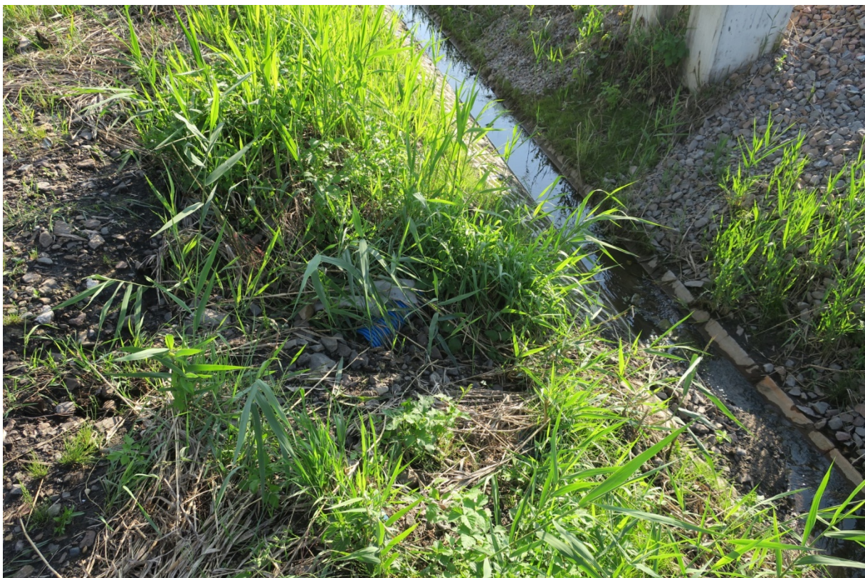
Rys. N017. Nadmiar wody zalegającej na nasypie na działce sąsiadującej z działką ROD „Podgórze” zdegradował nasyp i rów odwadniający podtorze.