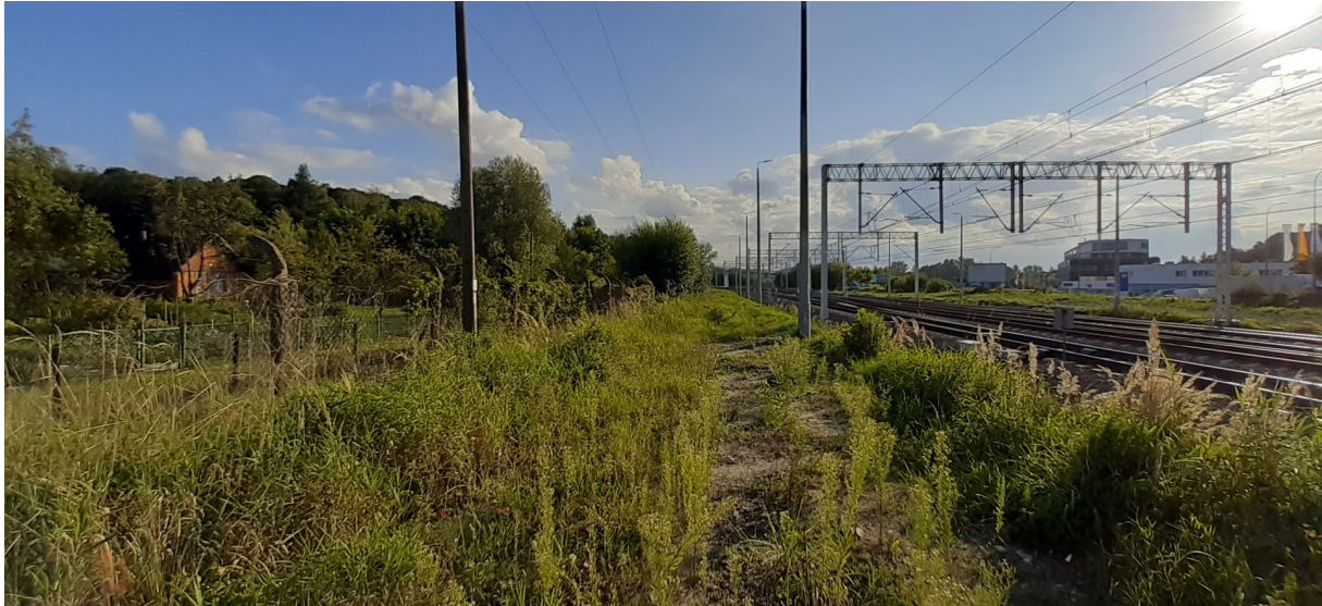
Rys. N08. Widoczne nachylenie nasypu na działce PKP w kierunku ogrodu ROD „Podgórze”.