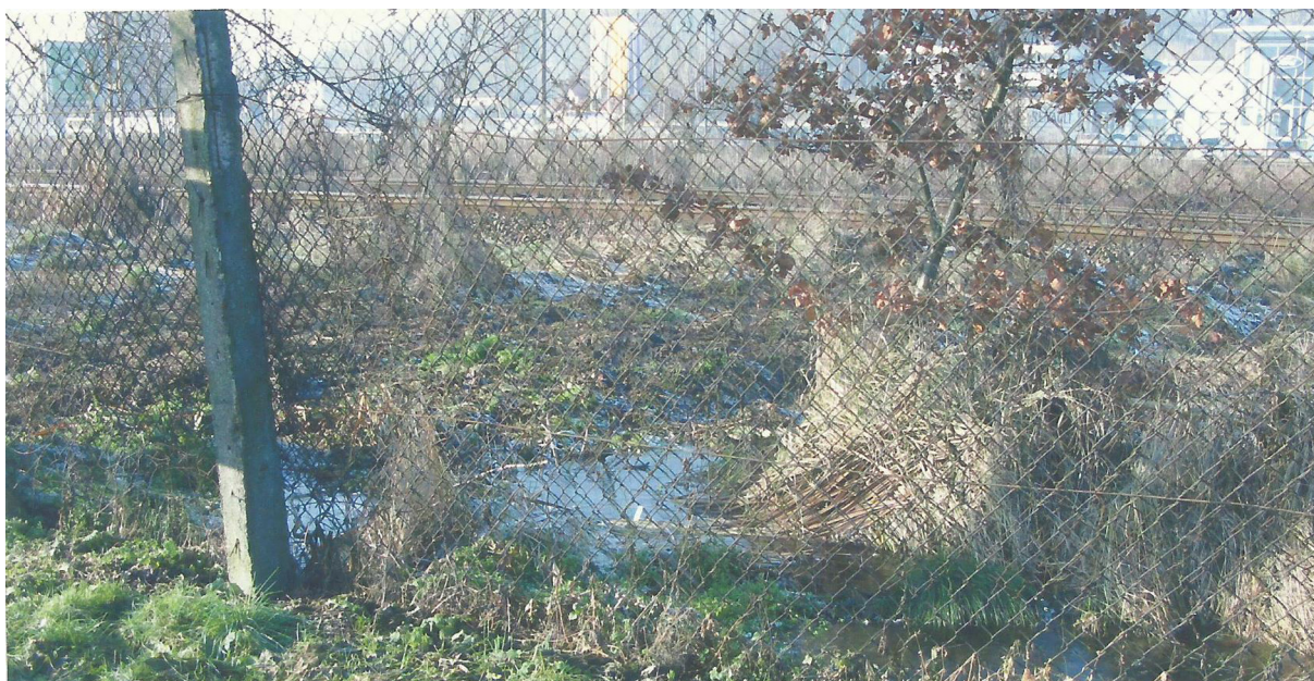
Rys. N02. Zdjęcie zrobione przed modernizacją linii kolejowej i przed podniesieniem wysokości nasypu na przylegającej działce PKP. Widać wodę na nasypie, na granicy z działką ROD „Podgórze”