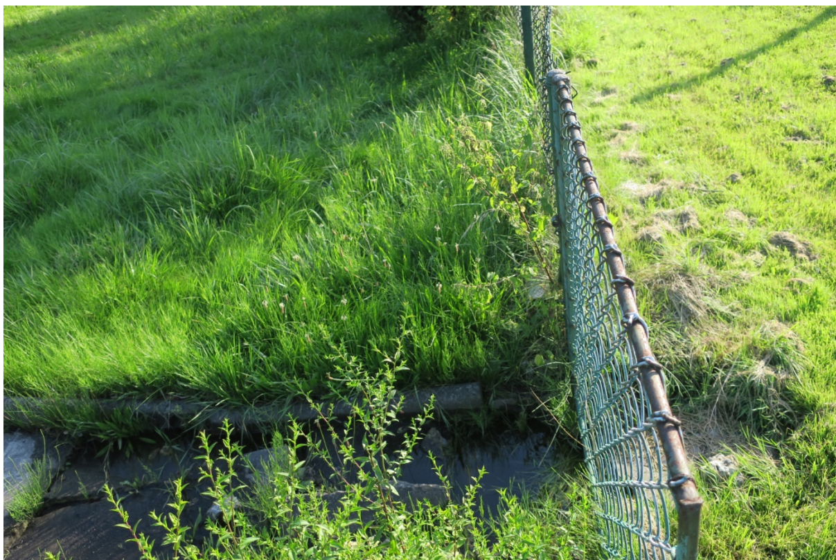
Rys. N05. Zalegająca woda na działce ROD „Podgórze”. Zbliżenie Rys. N04.