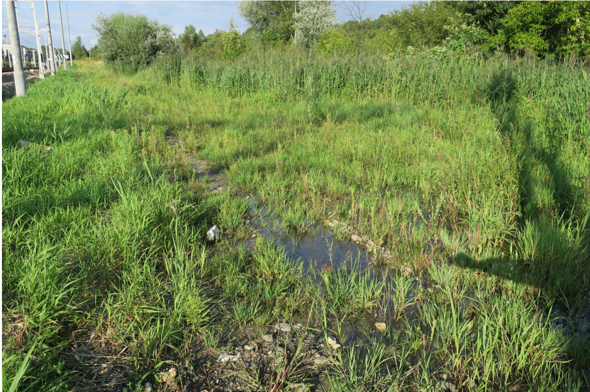
Rys. N14. Zalegająca woda na nasypie PKP, która nie spływa na sąsiednią działkę, bo cały teren jest podmokły z powodu braku rowu odprowadzającego wodę.