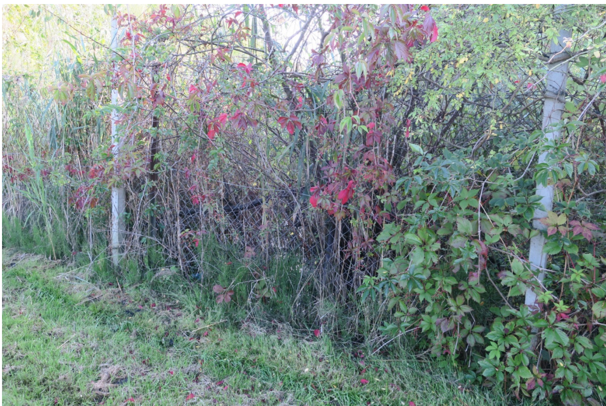
Rys. N06. Zalegająca woda na działce sąsiadującej od zachodu z działką ROD „Podgórze”, z powodu podniesienia nasypu kolejowego i braku rowu odwadniającego.