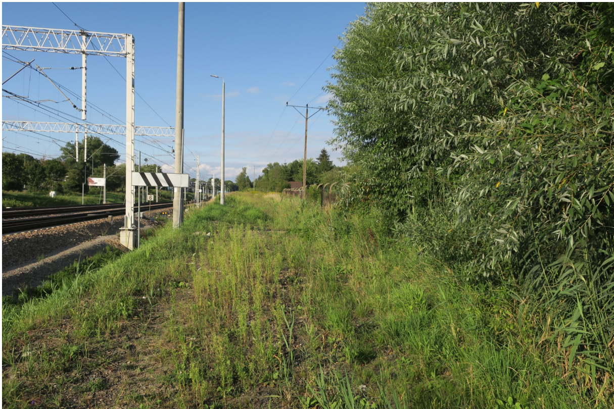
Rys. N12. Widoczne nachylenie nasypu na działce PKP w kierunku ogrodu ROD „Podgórze”.